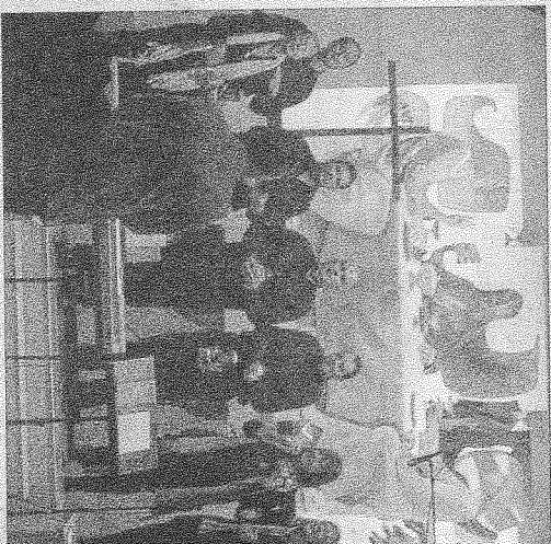
Le groupe vocal Blue Bamara, formé grâce au CE de STMicroelectronics et la chorale Altogether, venue de la banlieue de Munich ont soutenu par leur belle prestation l'association Mimi na wewe.